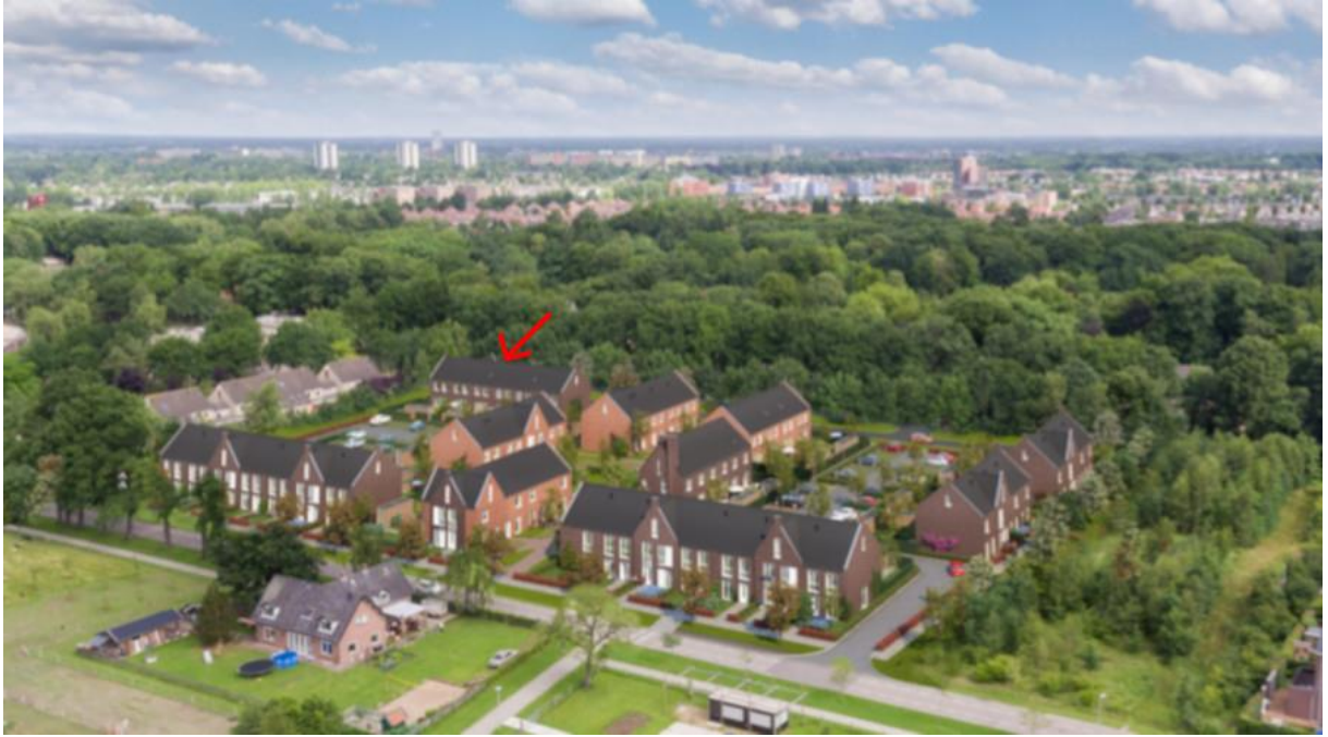
Afbeelding 2: de bouwlocatie in de toekomstige woonbuurt De Boshuizen